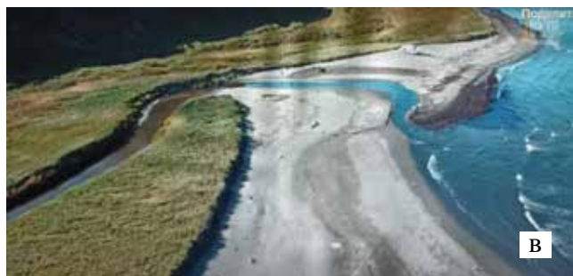
Рис. 5. Устье р. Командор (а – сент. 2013 г.; б – сент. 2015 г., в – сент. 2022 г.) (а и б – из Google Earth; в – [14])