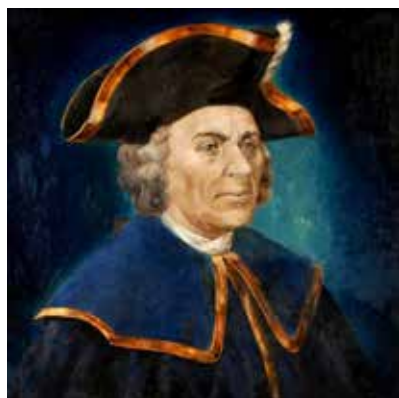
Рис. 1. Капитан-командор В.И. Беринг (1681–1741 гг.) (художник Е.В. Каллистова, 1999 г.)

For citation: Brovko P.F. Captain-Commander Vitus Bering: discoveries and name on a geographical map. Pacific Geography . 2024;(3):105-115. (In Russ.). https://doi.org/10.35735/26870509_2024_19_8 .