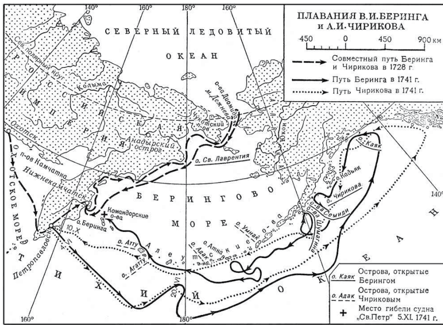
Рис. 2. Маршруты Первой и Второй Камчатских экспедиций [5] Fig. 2. Routes of the First and Second Kamchatka expeditions [5]

Охотское море. Всего за 1728–1729 гг. участниками Первой Камчатской экспедиции открыто и нанесено на карту 220 географических объектов [4].