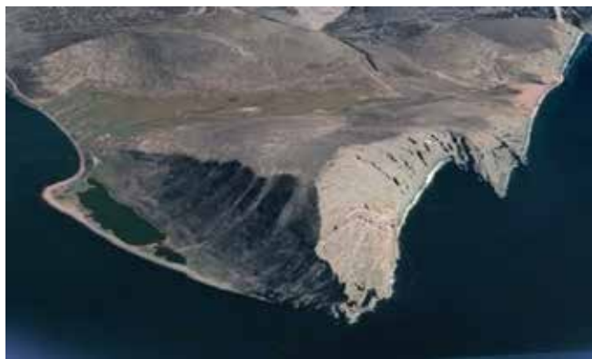
Fig. 4. Cape Bering in the Anadyr Bay (by the figurative expression of V. Bering "corner of the stony mountains")

имеет итоговая карта. Она основана на многочисленных астрономических наблюдениях и впервые дала реальное представление не только о восточном побережье России, но и о размерах, протяженности Сибири. Карта была рассмотрена и одобрена Академией наук. Итоговая карта также была использована учеными России и вскоре широко распространилась в Европе. В 1735 г. она была гравирована в г. Париж, спустя год опубликована в г. Лондон, потом снова во Франции. И далее карта неоднократно переиздавалась в составе различных атласов и книг [9].