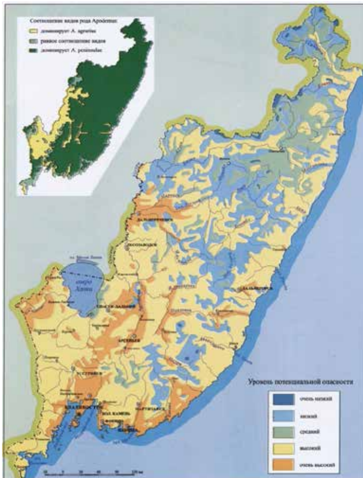
Рис. 4. Карта очагов потенциальной опасности инфицирования хантавирусами из атласа «Хантавирусная инфекция в Приморском крае»

По результатам этих исследований группой ученых под руководством С.Б. Симонова в 2007 г. впервые в нашей стране был создан медико-географический атлас одной нозофор-