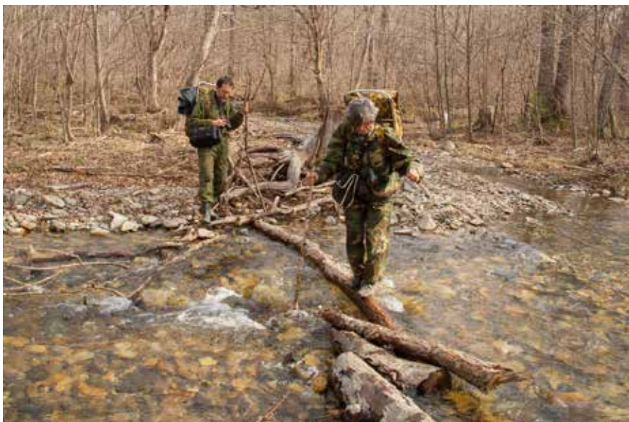
Рис. 1. С.Б. Симонов и Т.Л. Симонова преодолевают водную преграду на полевом выходе