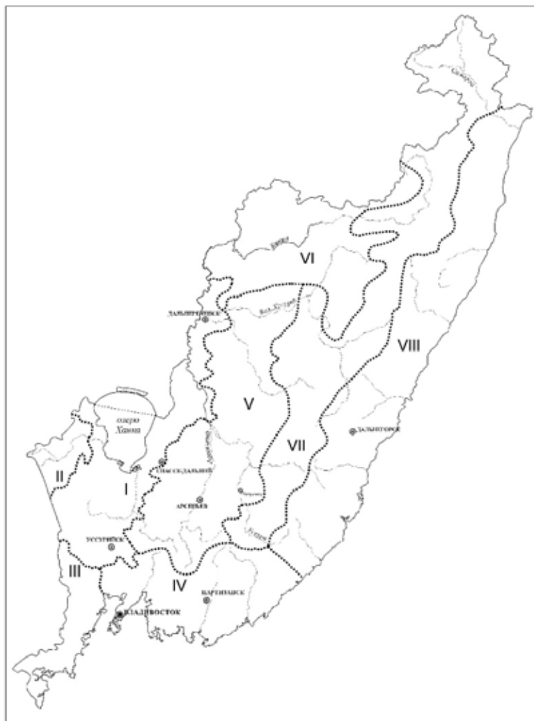
Рис. 5. Районирование Приморского края по хантавирусной инфекции.

Характеризуется отсутствием четкой периодичности. Основные генотипы, циркулирующие в лесных местообитаниях данной провинции, – Amur и Puumala (носители – восточноазиатская мышь и красно-серая полевка). На сельскохозяйственных землях освоенных горных долин значительно возрастает роль Hantaan . Амплитуда заболеваемости велика: минимальная – 2, максимальная – 27 случаев на 100 тыс. населения.