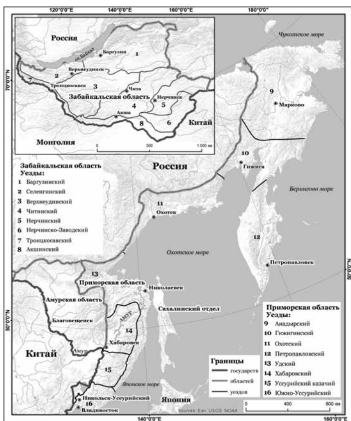
Рис. 1. Схема административно-территориального деления областей Приамурского генерал-губернаторства в 1900–1902 г. (составлена авторами с использованием «Карты Приморской области» [14] с уточнениями по [18], «Карты Забайкальской области» [19] с уточнениями по [20]).

В 1901–1902 гг. окружное деление областей в Приамурском генерал-губернаторстве было заменено на уездное [8]. АД региона в этот период представлено на рис. 1. Для Амурской области оказалось невозможным отобразить ее основные АТЕ (округ Амурского казачьего войска, Амурский уезд крестьянских селений и 3 горно-полицейских округа) [17], поскольку на картах того времени их границы не показаны.